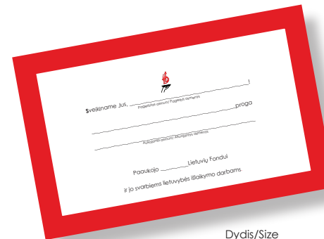
Įnašo sertifikatas Certificate of Donation

Prašau siųsti LF įnašo sertifikatą pagerbtam asmeniui. Please send an LF Certificate of Donation to the honoree as a record of my contribution.