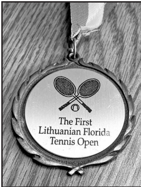
Teniso turnyro Floridoje medalis.

Amerikiečių rašytojas Zig Ziglar kartą pasakė: „Didžiausią reikšmę gyvenime turi tai, ką