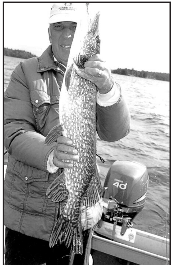
Nukelta į 13 psl. Pavykdavo sužvejoti ir tokias lydekaites.