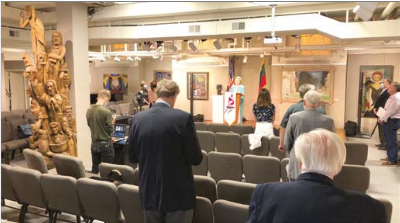
Lietuvių Fondo 57-asis metinis narių suvažiavimas. LF tarybos, valdybos nariai ir administracijos darbuotojai rinkosi Lietuvių dailės muziejuje, Lemont. Visi kiti LF nariai suvažiavime dalyvavo nuotoliniu būdu, prisijungę prie video platformos VIMEO. The Lithuanian Foundation's 57th Annual Members' Meeting. Members of the board and the administration staff gathered at the Lithuanian Museum of Art (Lithuanian World Center, Lemont, IL). All other LF members were invited to join the televised meeting virtually via the VIMEO link.